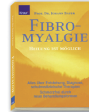
Knauer München ISBN 3-426-66747-9